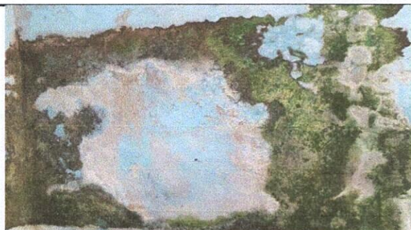
Foto 12: Se sellará esta pared con material adecuado para evitar humedad.

Observación: Si es necesario se pueden agregar hojas adicionales y actualizar el número de hojas.