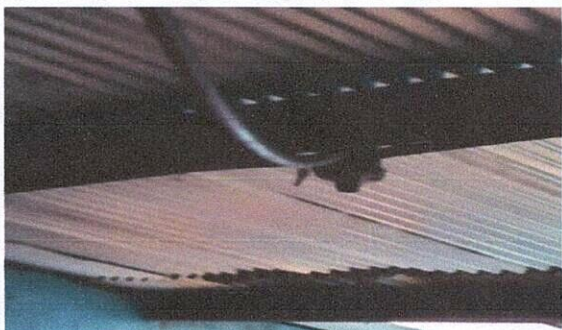
Foto 9: Se colocará un cableado electrico para la iluminación del centro educativo.